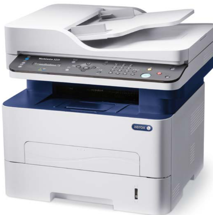
WorkCentre 3225. Copiere. Imprimare. Scanare. Fax. E-mail.